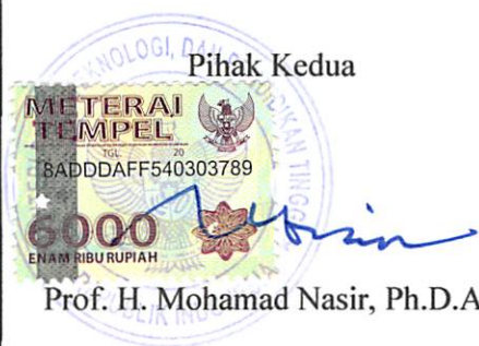
Prof. H. Mohamad Nasir, Ph.D.Ak

Pihak kedua akan melakukan supervisi yang diperlukan serta melakukan evaluasi terhadap capaian kinerja dari perjanjian ini dan mengambil tindakan yang diperlukan dalam rangka pemberian penghargaan dan sanksi.